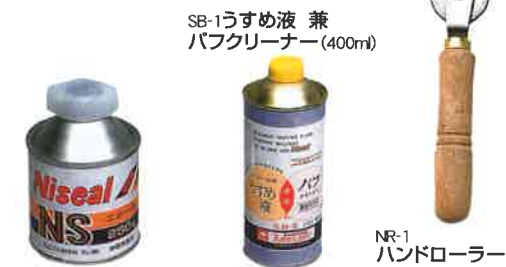
NS-250 ニシール(ハケ付) (250g)