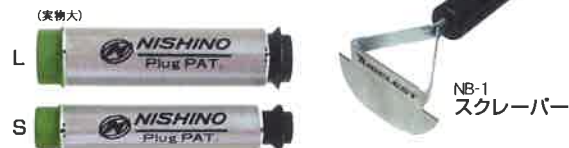
(実物大) L NISHINO Plug PAT S NISHINO Plug PAT